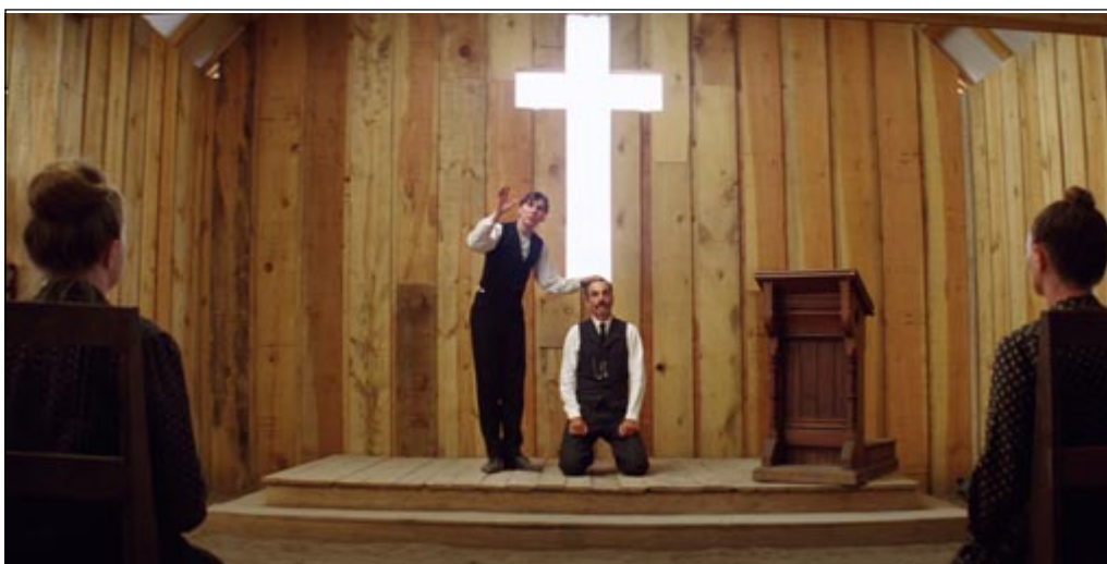
Sunday ja Plainview toteuttavat rituaalin. Rituaali on suunnattu seurakunnalle. Huomaa seurakunnan oletettu katse. Katsovatko he, uskovatko? Katso elokuva.

Jälleen Eli Sundayn tarina voitaisiin katsella öljymiehen toiminnalle rinnakkaisena ja sen tahdissa resonoivana kehityskulkuna, joka vahvistaa öljymiehen draaattisen opetuksen yhtäläillä epäonnistuvan ju-