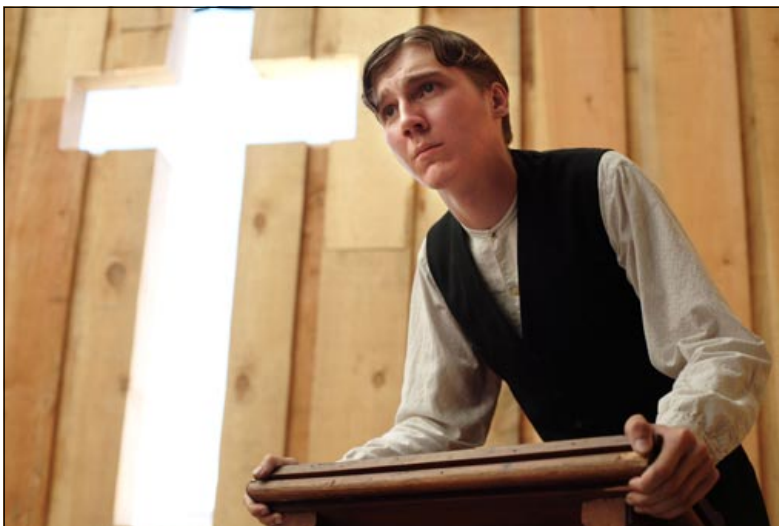
Eli Sunday ja sana tulee lihaksi.

Selvästi näkeminen tarkoittaa tässä tarinassa henkilötasolla kuitenkin jotain ikävää. Se tarkoittaa Ison toisen eli