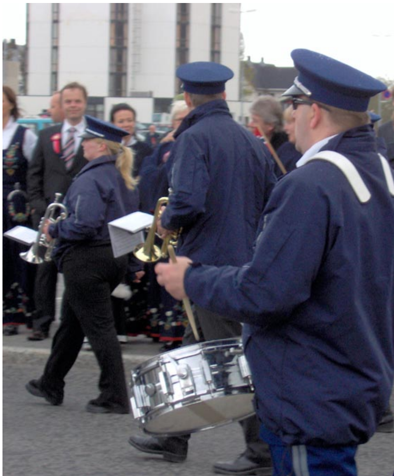
Rumpujen pärinää Svolveerissa

Viikonloppuna kuuntelemani Bartokin ja Prokofievin teokset soivat päässäni vielä viikon alkupäivinäkin. Voi tätä itseni, mielikuvituksen ja todellisuuden kolmiodraamaa. Miten kirjailijoiden ja säveltäjien mielikuvitus muistuttaakin todellisuuttani, mutta miten oma mielikuvitukseni onkaan niin erilainen kuin todellisuus. Musiikki ja kirjallisuus ovat arvokkaita siksi, että niiden kanssa voi käydä dialogia sivistyneesti. Ihmisten kanssa keskusteleminen on vaikeaa. Joko loukkaannut itse tai loukkaat muita. Tai sitten tapahtuu molemmat. Sen sijaan kirjat ja musiikkikappaleet ovat siinä suhteessa hieman helpompia, ne kyllä sanovat mielipiteensä ja toisaalta kyllä myös kuuntelevat vastakkaisia mielipiteitä.