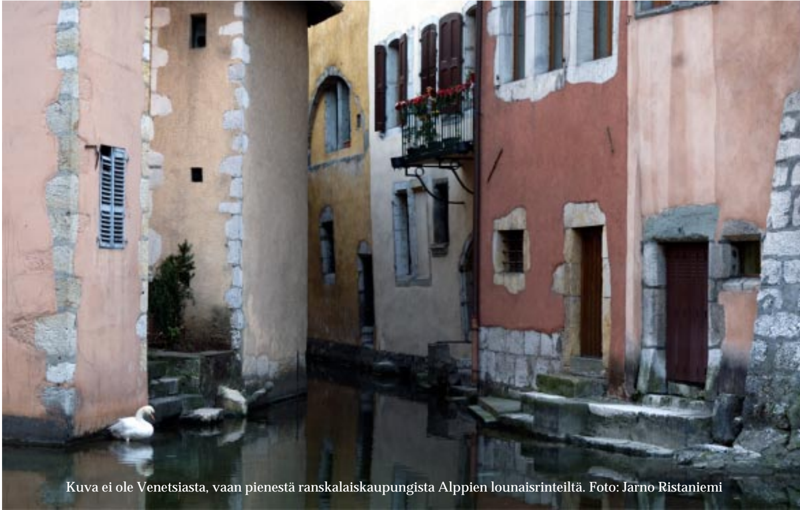
Kuva ei ole Venetsiasta, vaan pienestä ranskalaiskaupungista Alppien lounaisrinteiltä.