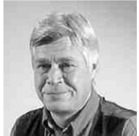
FT, dos., erikoistutkija

Nykyisin paikallisuuteen liittyy myös vahva eettinen lataus autoilun ja lentämisen aiheuttaman ympäristö-rasituksen vuoksi. Pentti Linkolan sanoin: ihmisen pitäisi elää siten, että aamulla herätessään hän näkee ikkunaan