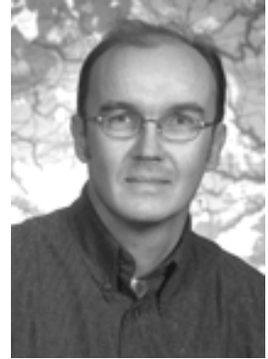
FT yliopistonlehtori

esteettisesti merkittävä vuori jne. voi olla eettisesti huomioitava kohde. Etiikan historiassa jo ihmisen määrittely on ollut metafyyssinen kiistakysymys. Aristoteles ei pitänyt orjia täysin ihmisenä vaan pikemminkin työvälineinä: siksi niitä saikin kohdella kuin työvälineitä. Vaikutti mielettömältä kysyä, tuleeko työvälineen onnellisuutta pyrkiä edistämään – siksi etiikka koski Aristoteleen mielestä vain toisia 'täysivaltaisia' ihmisiä, vapaita kreikkalaissyntyisiä miehiä.