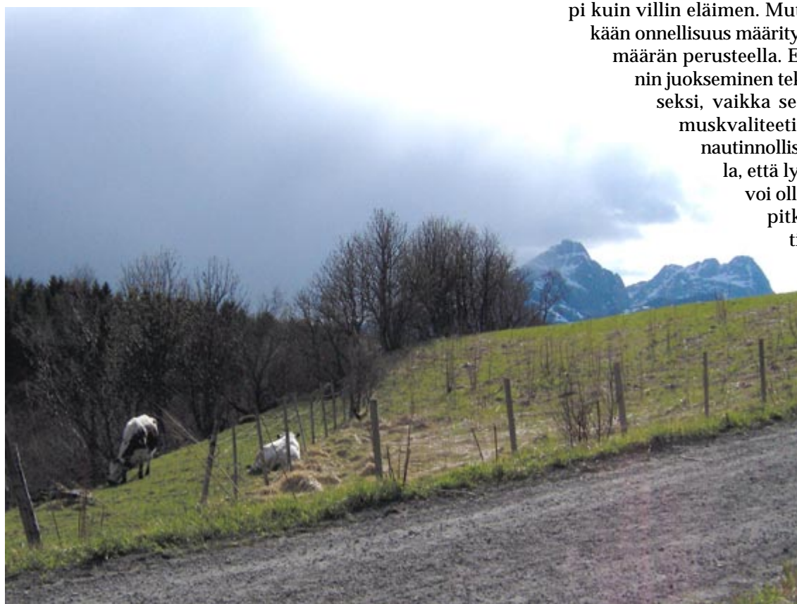
Lehmät laitumella. Viikinkimuseo Lofotr, Berg, Lofootit

Villi eläin elää vapaana luonnonympäristössä omassa ekologissa lokerossaan, johon se on evoluutiivisesti sopeutunut. Korkeammilla eläimillä myös kulttuuri, taitojen oppiminen ja opettaminen, on oleellinen osa tätä sopeutumista. Eläimen toimintamahdollisuudet