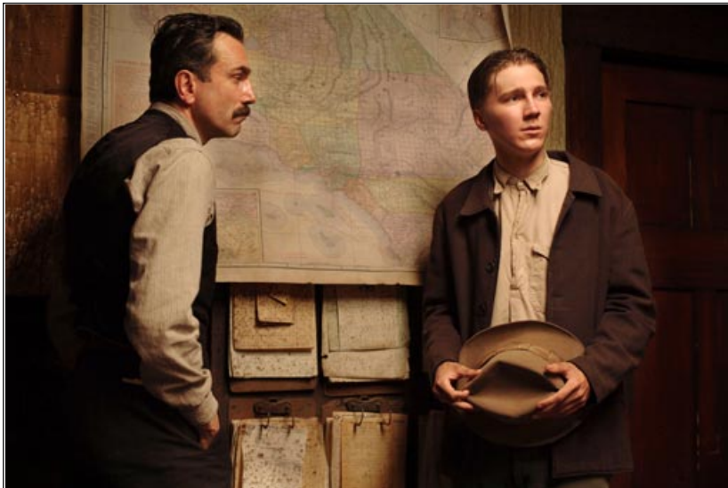
Plainview ja Sunday. Öljyn geopolitiikka hiostaa taustalla.

Mikä rooli Danielin pojalla sitten on? Ehkäpä vastaus löytyy pojan kuuroutumisesta. Poika menettää kuulonsa isän öljylähteen avaavassa räjähdyksessä. Isä on saavuttanut tavoitteensa, mutta yhteys Toiseen on katkennut. Poika ei kuule isäänsä enää koskaan. Poika ei ole uskomassa isänsä puolesta. Poika ei ole uskomassa Isäänsä amerikkalaisena unelmana. Poika saa mennä ensimmäisen kerran heti kuurouduttuaan, kuten amerikkalainen unelmakin. Onhan pojan kykenemättömyys kuulla isän tarinaa syynä