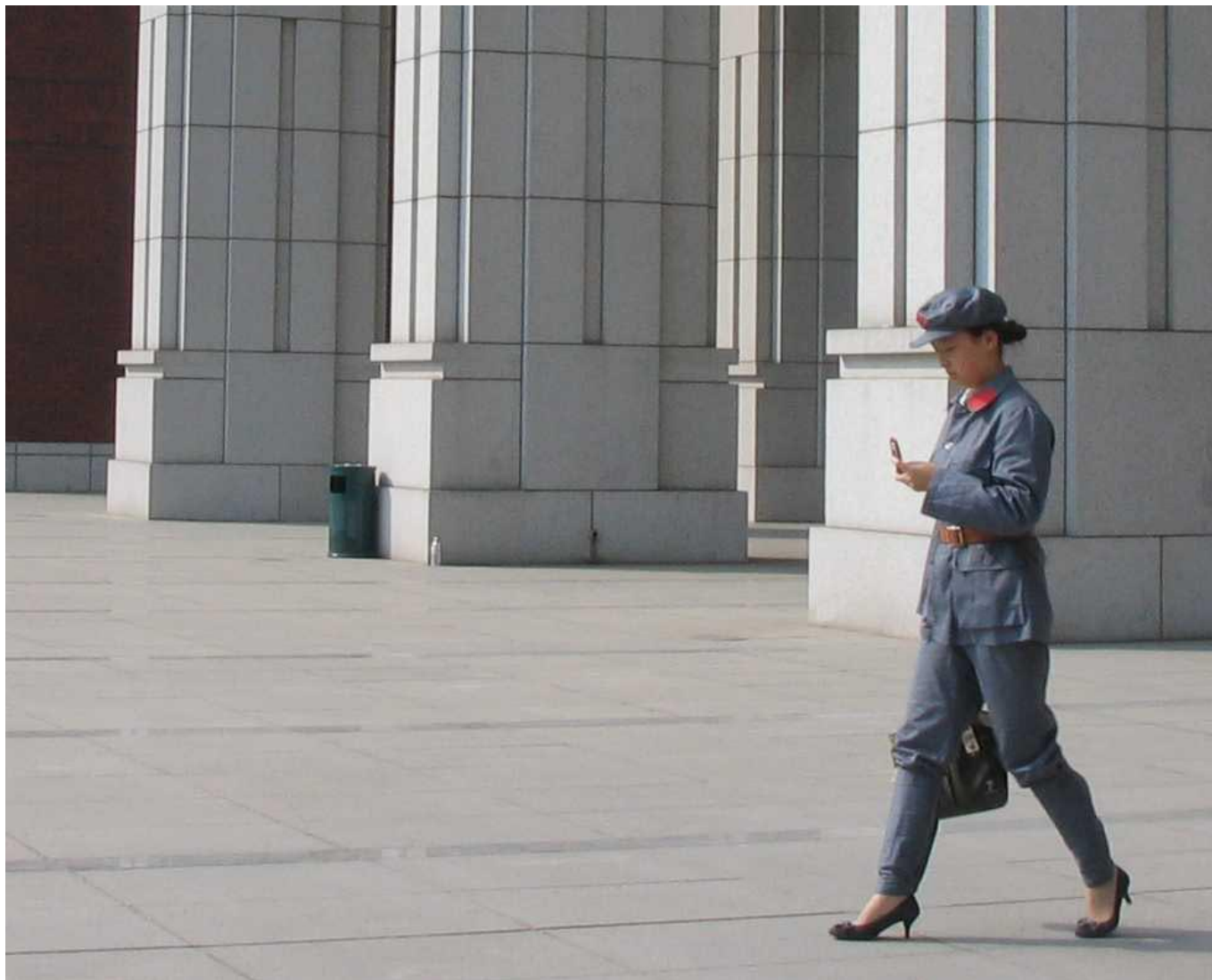
Moderni Kiina: korkokenkiin ja kansanarmeijan univormuun sonnustautunut opiskelija selaa vauhdissa kännykkää lähellä Renmin-yliopiston taloustieteen laitoksen sisäänkäyntiä.

vokkaalla paikalla on pari tuhatta vuotta vanha kiinalainen oikeus.