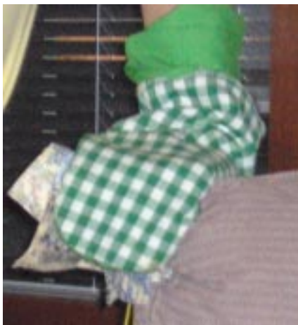
Onko tämä lätkähanska?

set opettavan tiedon ontologiasta, epistemologiasta ja tekhnélogiasta (taito-oppi). Tiedekunnat ja niissä opettavat oppiaineet ovat kuin erillisiä ja eroteltavia, mutta se mikä kannattelee kaikkea opetusta ja oppimista, ei ole eroteltavissa. Se on se