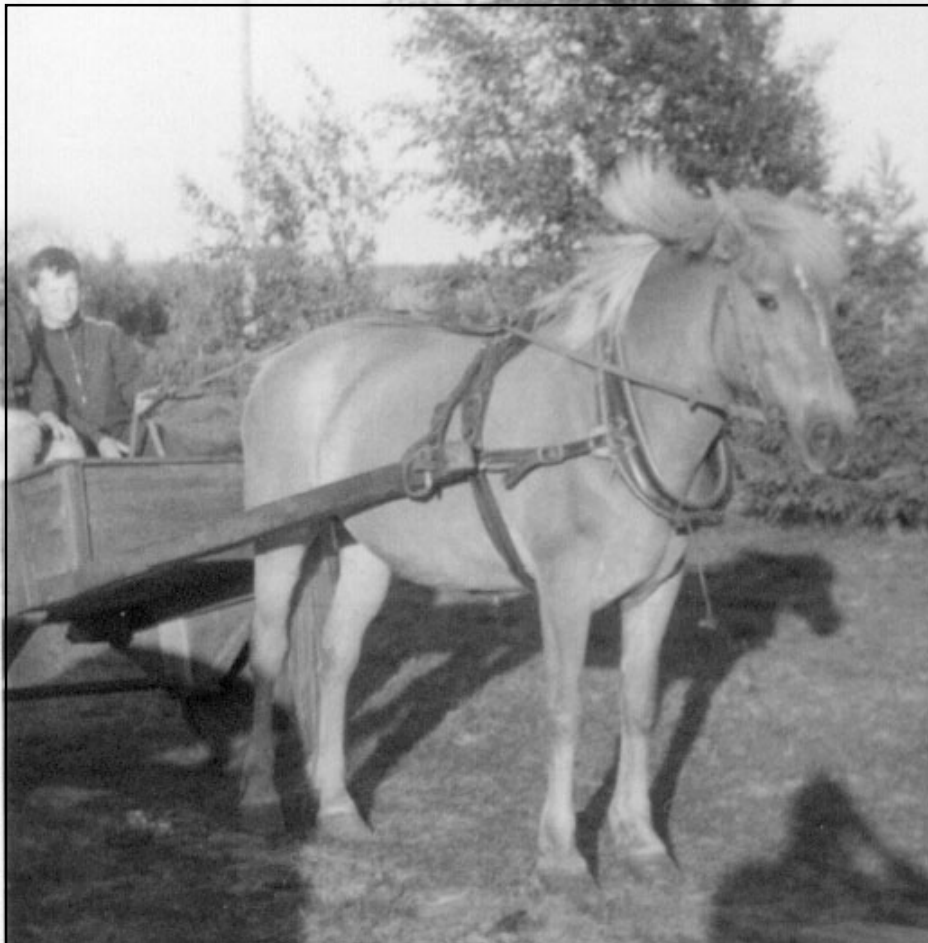
Rahalla saa ja hevosella pääsee!

1 Totuudellisuus esiintyy Hegelin pe-rintönä myös Snellmanilla, Clevellä ja Sa-lomaalla.